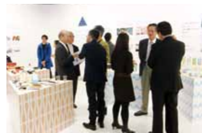
交流会には富山県知事石井隆一も出席し、参加者との交流を深めました。