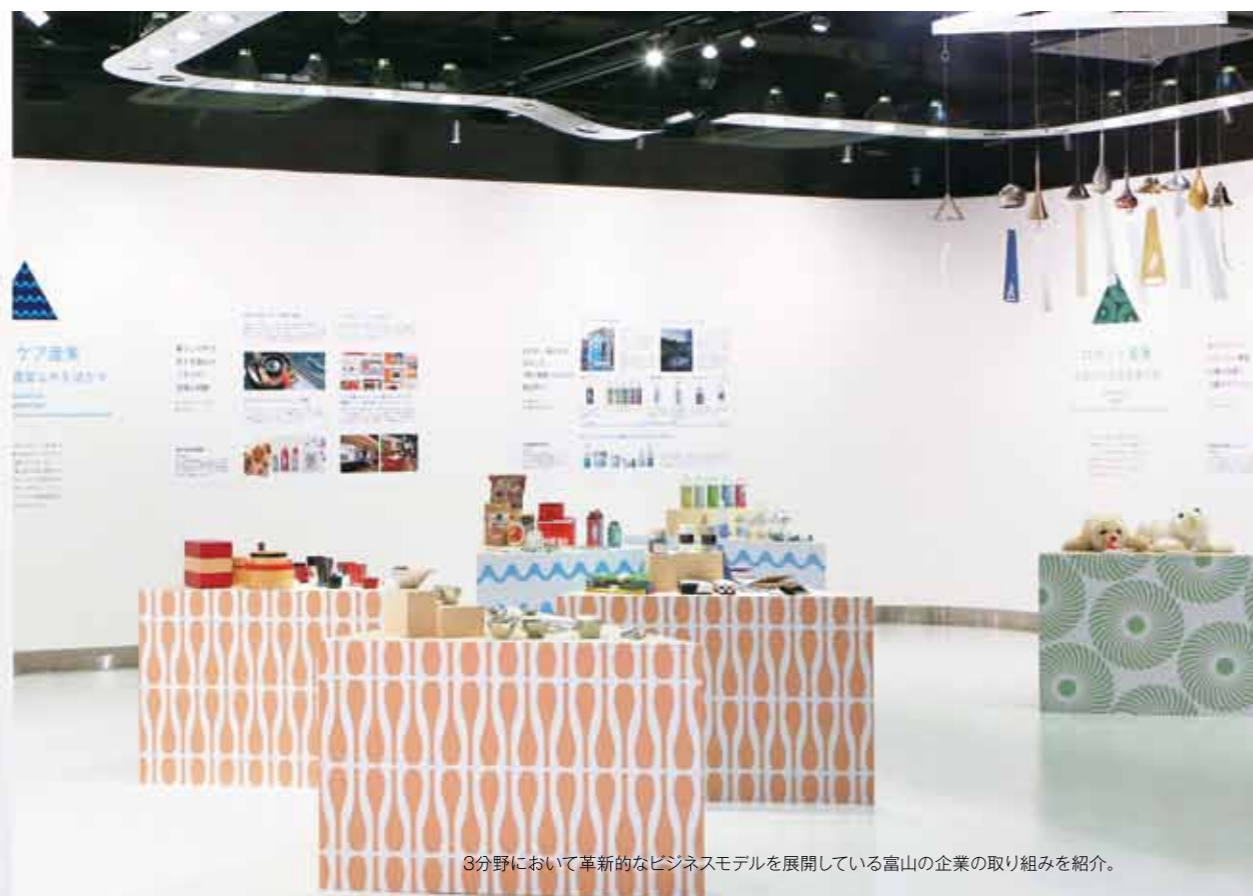
3分野において革新的なビジネスモデルを展開している富山の企業の取り組みを紹介。