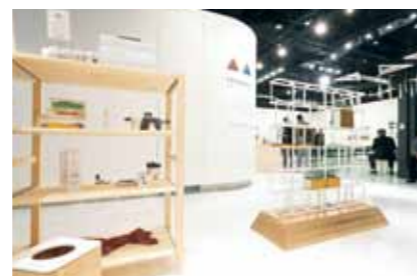
富山プロダクツ選定商品の中から「建材」「エコ」「福祉・健康」「日用品」関連の商品も展示。