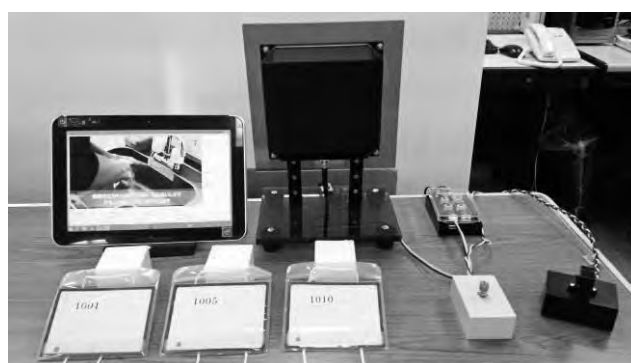
図 2 タグによる管理装置（一部）