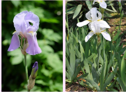
Iris pallida Iris florentina (シボリイリス) (ニオイアヤメ)